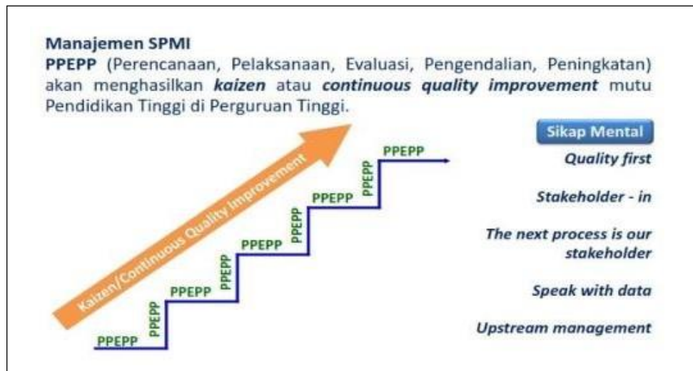
Gambar 1 Manajemen SPMI

Pelaksanaan Penjaminan Mutu ini mengacu pada siklus penjaminan mutu yang ditetapkan dalam standar ISO 21001:2018 yang juga hampir sama dengan siklus yang ditetapkan dalam Permenristek Dikti No 62 tahun 2016. Dalam ISO siklus tersebut disebut dengan PDCA, sedangkan dalam SPMI disebut dengan PPEPP. Siklus tersebut dilakukan secara berkelanjutan melalui model continuous improvement ini, UIN SATU Tulungagung menetapkan tujuan dan diwujudkan berbasis strategi dan kegiatan yang sesuai. Model dari siklus SPMI tergambar pada gambar 1.