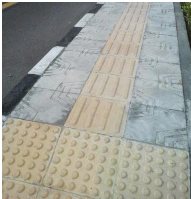
Gambar 2. Guiding Block

memungkinkan tunanetra berjalan lurus ke arah yang diinginkan. Jalur pemandu biasanya berupa bagian permukaan jalan/lantai yang warna dan teksturnya berbeda (lebih kasar).