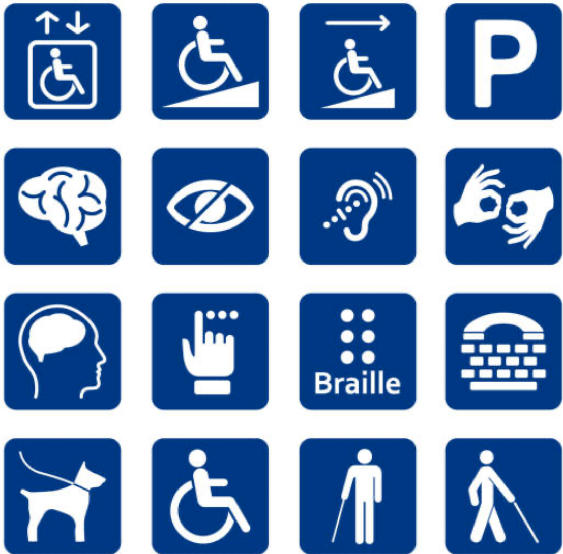
Gambar 1. Simbol Penyandang Disabilitas

https://infografis.okezone.com/detail/778239/7-simbol-simbol-disabilitas-penting-untuk-dipelajari