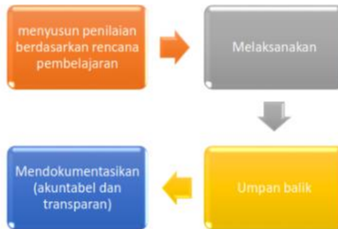
Gambar 1. Mekanisme Pelaksanaan Penilaian

Mekanisme penilaian terdiri dari beberapa tahapan: perencanaan, pelaksanaan, pemberian umpan balik, dan pendokumentasian seperti pada Gambar 1. berikut: