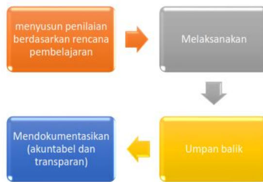
Gambar 1. Mekanisme Pelaksanaan Penilaian

Mekanisme penilaian terdiri dari beberapa tahapan: perencanaan, pelaksanaan, pemberian umpan balik, dan pendokumentasian seperti pada Gambar 1. berikut: