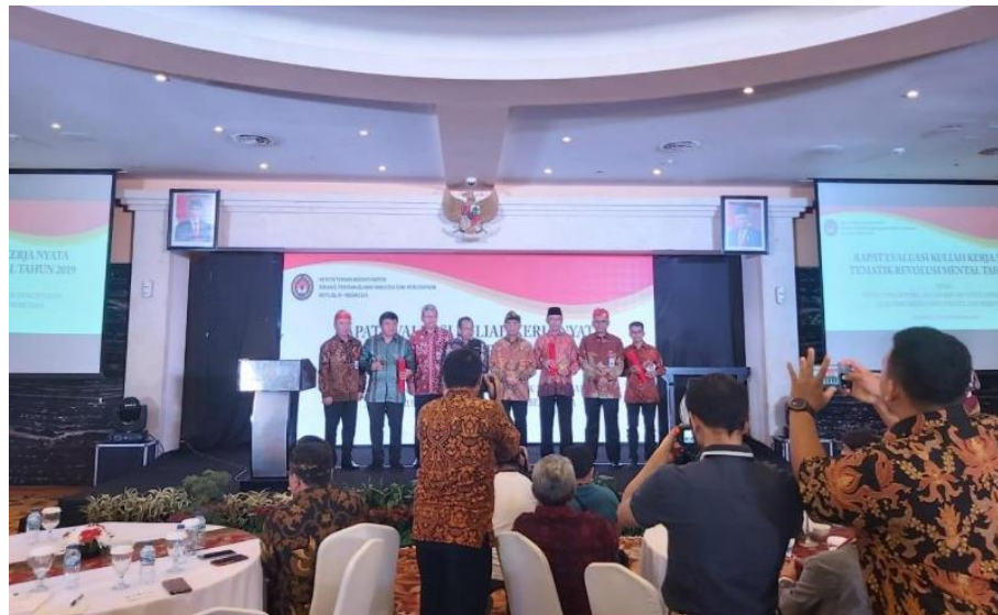
Gambar 4: Foto Penyerahan Penghargaan KKN Revolusi Mental