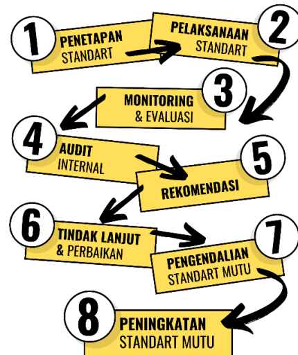
Gambar 1.1 Siklus PPEPP UIN SATU Tulungagung

koordinatif yang jelas dan tegas. Upaya peningkatan mutu diawali dengan penetapan standar, pelaksanaan standar, evaluasi pelaksanaan standar, pengendalian pelaksanaan standar dan peningkatan standar (PPEPP).