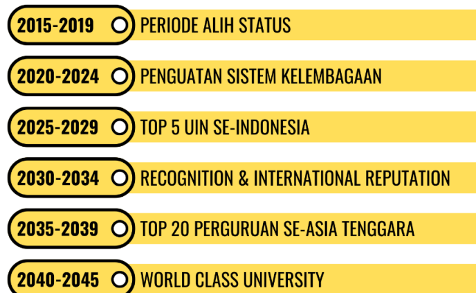
Gambar 1.2 Milestone UIN SATU Tulungagung 2020 – 2045.

Rencana pentahapan sistem penjaminan mutu UIN SATU Tulungagung mengacu pada tahapan Rencana Induk Pengembangan (RIP) UIN SATU Tulungagung 2020 – 2045. Tahapan tersebut sebagai berikut: